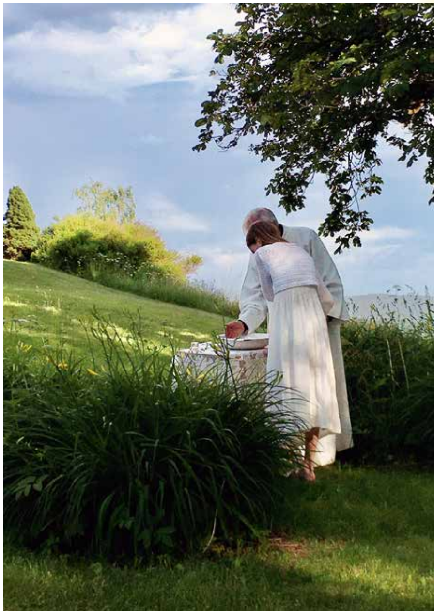
Dåp ved Skoger gamle kirke 16. juni 2020.

og det er leit at det ikke har latt seg gjøre å få lagt den nasjonale pilegrimsleden innom kirken. Men heldigvis går pilegrimsleden inn i Mælen og videre mot Fjell. Da går den blant annet over vår eiendom, og jeg gleder meg til å bo der hvor pilegrimene skal gå!